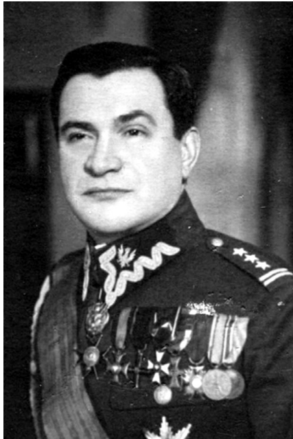
Bronisław Wilhelm Pieracki (1895-1934) Patron Szkoły Powszechnej w Rudzie-Hucie od 1935 r.

Od czerwca 1931 r. pełnił funkcję ministra spraw wewnętrznych. Z jego inicjatywy w marcu 1934 r. powołany został Komitet do Spraw Narodowościowych.