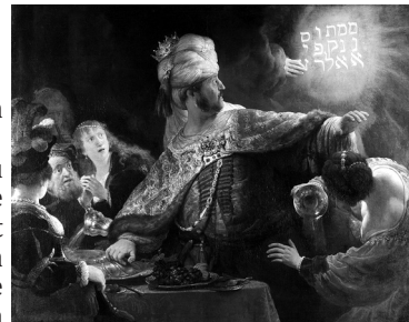
Uczta Baltazara według Rembrandta

Wierzący wiedzą, że żadna rzecz poświęcona religii nie może być profanowana. Rozważnie używajmy przedmiotów przeznaczonych do swoich celów. Krzyżek na piersi niech staje się manifestacją naszej wiary a różaniec w naszych rękach jako jedna z licznych form modlitwy. Kim dzisiaj chcesz być po przeczytaniu tego artykułu? Królem Baltazarem z księgi Daniela czy katolikiem wiedzącym do czego dana rzecz służy?