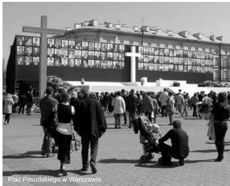
Plac Piłsudskiego w Warszawie.

Ziemia katyńska po raz kolejny wchłonęła polską krew. Trudno znaleźć odpowiednie słowa, by opisać rozmiar tej tragedii. Dlaczego dopiero takie wydarzenia muszą uzmysławiać światu, a zwłaszcza Europie o tym, co wydarzyło się wiosną 1940 roku? – powiedziała w swoim przemówieniu Dyrektor LO.