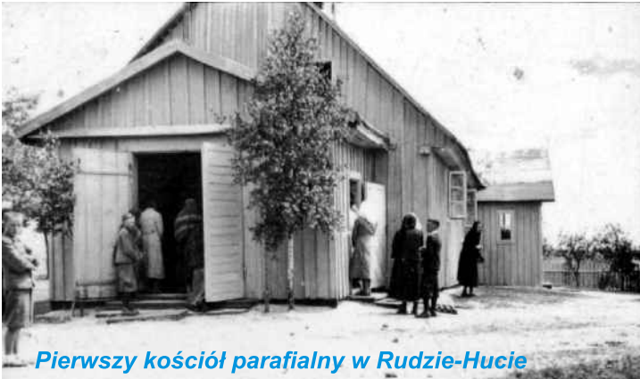
Pierwszy kościół parafialny w Rudzie-Hucie