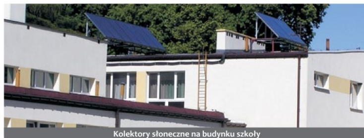
Kolektory słoneczne na budynku szkoły

Po raz kolejny zostaliśmy docenieni w niezależnym Rankingu Związku Powiatów Polskich. W kategorii gmin wiejskich utrzymaliśmy ósme miejsce w kraju i najwyższą pozycję w województwach Polski Wschodniej. Dodatkowo realizacja projektów związanych z wykorzystywaniem energii słonecz-